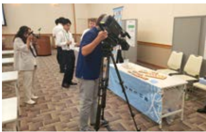
参加企業 / 4社